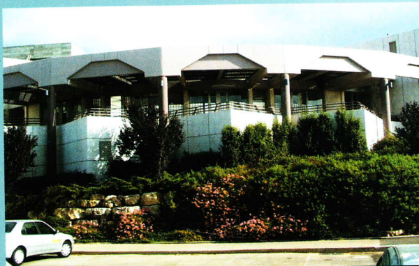
פינה בטכניון, חיפה

"מי שמסרב להאמין במסורת של עם ישראל, נאלץ לכוף ראשו בפני ההוכחות המדעיות לאמיתותה ואמינותה של מסורת התורה שהועברה בדקדקנות מדור לדור."