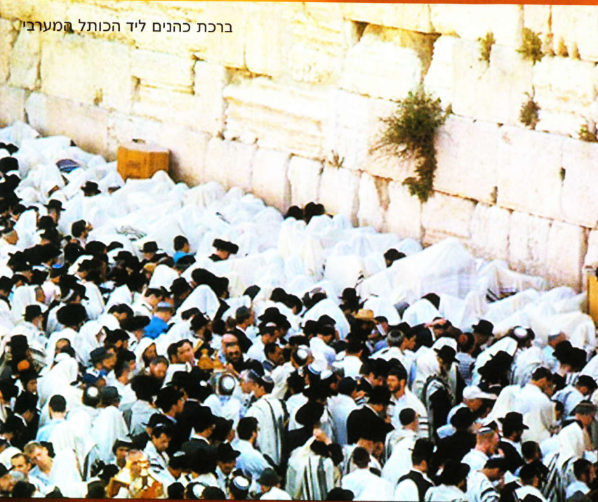
ברכת כהנים ליד הכותל המערבי

כ ידוע, כאשר יצאו ישראל ממצרים, האדם היחיד שהוכתר בתואר כהן היה אהרן, אחיו של משה רבינו, משבט לוי. שאר בני השבט, ומשה בתוכם, נותרו לויים ולא קבלו את תואר הכהונה.